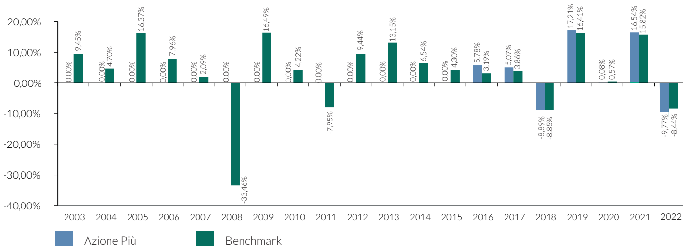
Tav. 4 – Rendimenti netti annui (valori percentuali) Rendimento annuo della Unit Linked e del Benchmark